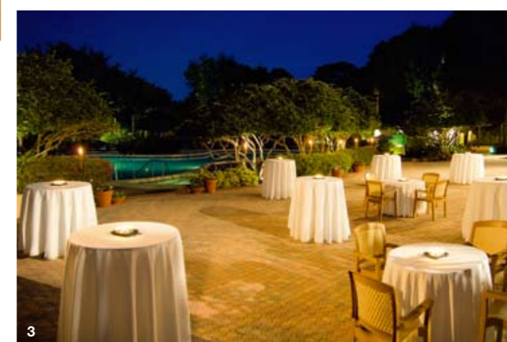
1.大柏树度假村会所外的每一处景观都被精心装饰过 2.高雅的设计让屋内屋外都是望不尽的美景 3.游泳池旁点上蜡烛的小圆桌在月光下透出浪漫气质