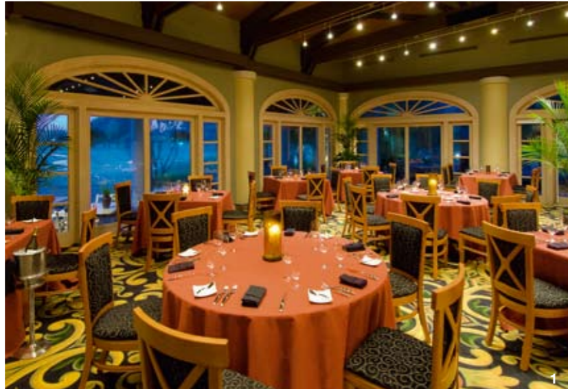
1.招牌餐厅Nine18是典型的地中海装修风格 2.大柏树高尔夫学院聘请了PGA和LPGA认证的专职教练 3.大柏树度假村被多次评为“佛罗里达最美度假村”